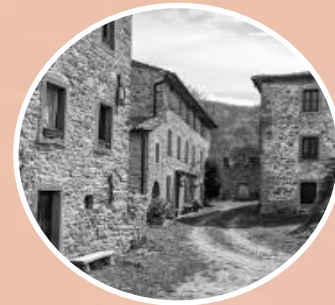
Il borgo abbandonato